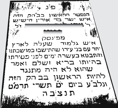
"הערת המערכת: טוטשנו את שמו של הנפטר, כדי להמנע מפגיעה בכבודו.

חברים יקרים ב"מאורות הדף היומי", שלום. לפני זמן מה, שוחחתי עם ידיד טוב, ניסיתי להסביר לו את חשיבות הלימוד, ואת הכח הסגולי העצום שיש לכל מילה שיהודי מוציא מפיו. לאחר זמן מה, הזדמנה לידי התמונה הזו, הראתי לו אותה, והוא הפטיר: תמונה אחת שווה יותר מאלף מילים אני שולח גם לכם את התמונה הזו, תמונה של מצבה מבית הקברות בפתח תקווה.